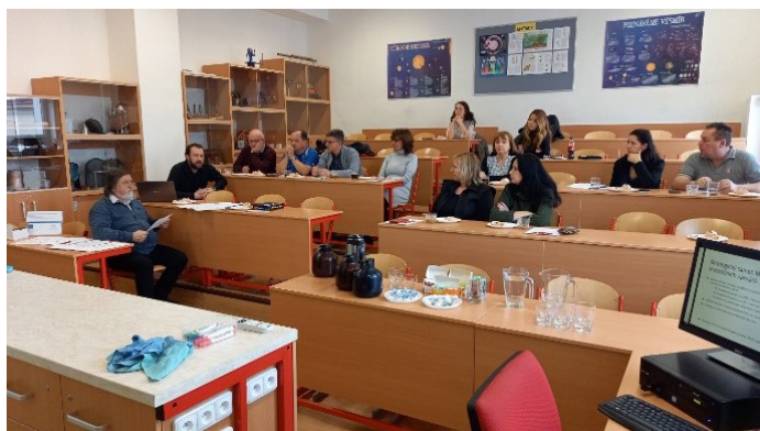
Setkání ŘV 12. 10. 2023

Pro vzdělávání na rok 2023 byli stanoveny jasné cíle, tedy udržet vše osvědčené a funkční a připravit nové a potřebné.