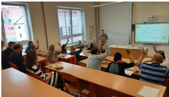
Setkání ŘV 2. 2. 2023

a to včetně průběhu v MAP III. Hodnocení probíhalo, dle nastavených pravidel na všech úrovních od žáků, učitelů, členů pracovních skupin, ředitelů až po Řídicí výbor MAP. Ze série dotazníkových šetření a strukturovaných rozhovorů pak vznikla Závěrečná evaluační zpráva, jejíž závěry a výsledky sloužily k nastavení navazujícího projektu MAP s pořadovým číslem IV. Na základě všeho výše uvedeného projektový tým MAS Hlinecko úspěšně podal žádost na projekt MAP IV, který opět umožní realizaci vzdělávacích aktivit směrem do území.