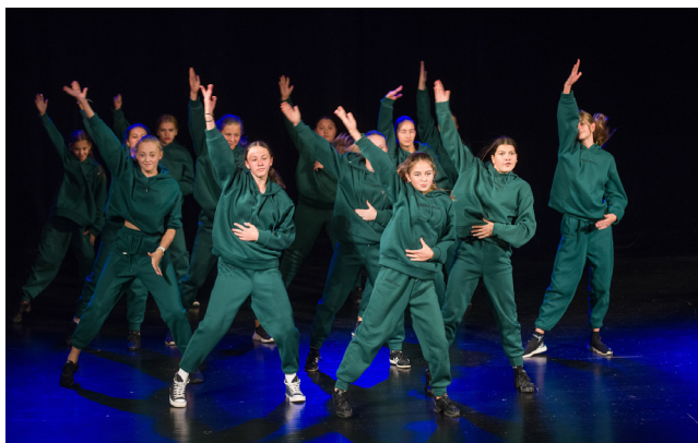
Vystoupení TS Ridendo