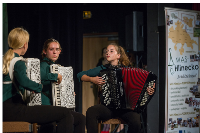
Vystoupení ZuŠ Hlinsko – akordeonové trio ELIHABA