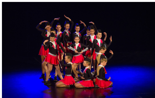
Vystoupení mažoretek z DDM Hlinsko