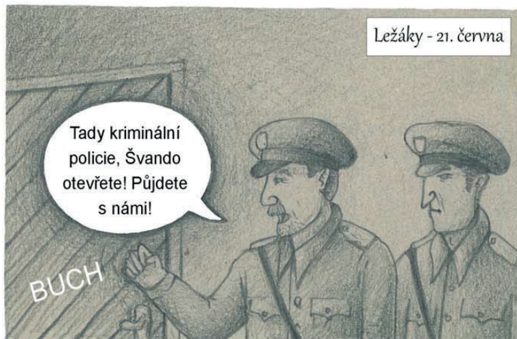
Ležáky - 21. června

Musím jistit Potůčka, než ráno odjede do Bohdašína.