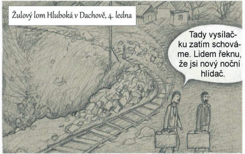
Žulový lom Hluboká v Dachově, 4. ledna

Tady vysílačku zatím schováme. Lidem řeknu, že jsi nový noční hlídač.