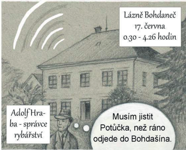
Lázně Bohdaneč 17. června 0:30 - 4:26 hodin

Vysílačku máme a gestapu jsme unikli. Musíme odjet do Bohdanče.