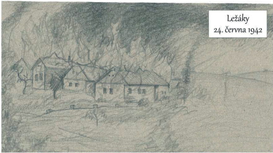
Ležáky 24. června 1942