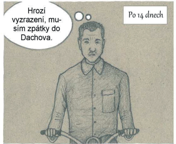
Po 14 dnech

Hrozí vyzrazení, musím zpátky do Dachova.